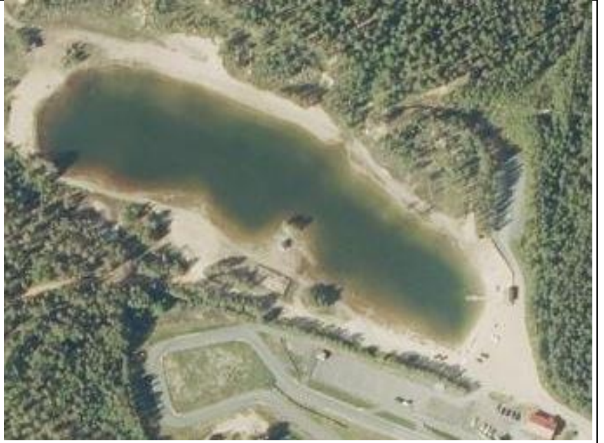
Kuva. Kalajoen kaupunki, ympäristöterveydenhuolto